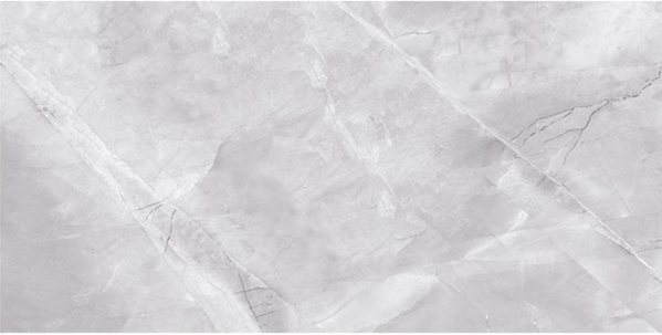
3.1 Yüzey deseni