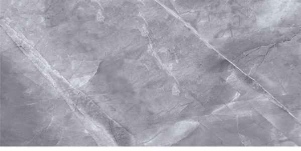
1.1 Yüzey deseni